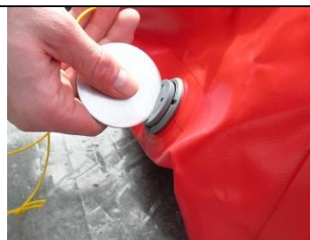
6 Zufuhr Matte rot öffnen