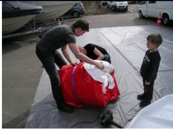
9 Matte rot mit Zurrfix Spanngurte umgeben, separates Blachenstück unter Verschluss legen (doppelt)