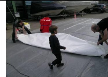
12 Matte weiss halbieren (längs, 1. Mal)