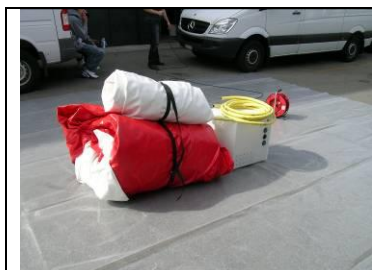
1 Material auslegen: Kabelrolle, Ausgleichsgerät (Box weiss), Luftschläuche, Matte rot, Matte weiss