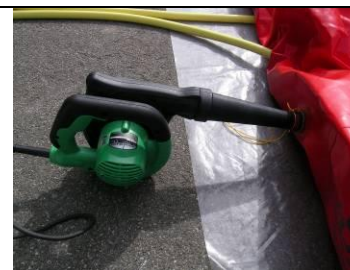
7 Kompressor anschliessen und Matte rot aufpumpen (satt, aber nicht zu satt!)