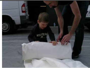
14 Matte weiss einrollen