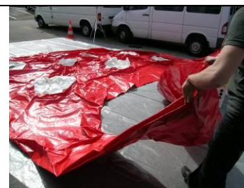
3 Matte rot aufklappen; Matte weiss in Aussparung hineinlegen