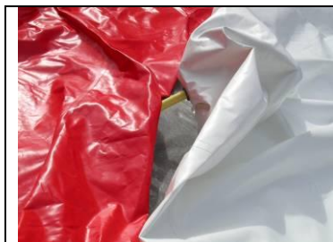
5 Schlauch lang an Matte weiss und Ausgleichsgerät anhängen, Ausgleichsgerät laufen lassen