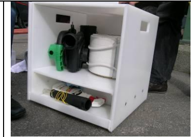
16 Matte weiss ebenfalls mit Zurrfix Spanngurte zusammenbinden; Ausgleichsgerät aufräumen