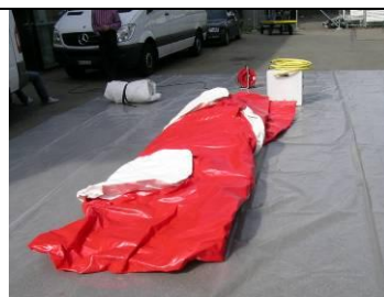
2 Matte rot ausrollen