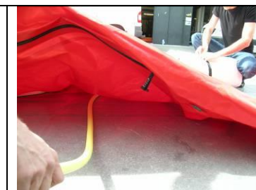
4 Schlauch lang unter Matte rot hindurch legen