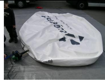
11 Luftschlitz bei Matte weiss öffnen, Luftschlitz wieder schliessen und mit Kompressor Luft absaugen