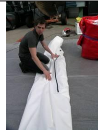
15 Luftschlitzen (Verschluss) darf nicht geknickt werden!