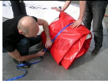
10 Zurrfix Spanngurte über separatem Blachenstück anziehen (kein Metall direkt auf Sprungmatte!)