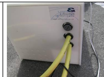
8 Kompressor abhängen; Schlauch kurz an Matte rot und Ausgleichsgeräte (unten) anhängen