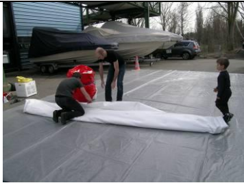
13 Matte weiss halbieren (längs, 2. Mal)